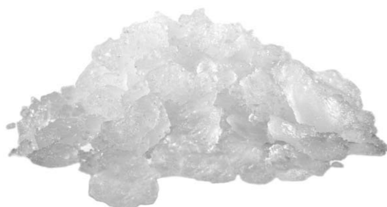
ICE QUEEN HIELO GRANUALDO