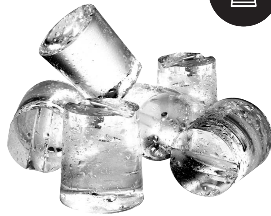
SUPER STAR 55GR