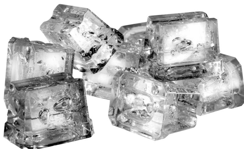
ALFA 15 | 50GR