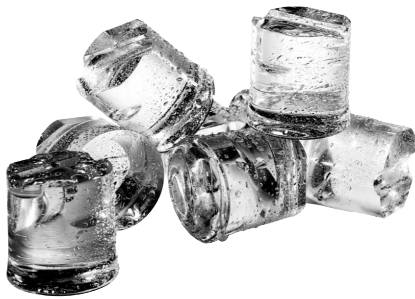
PULSAR 38 | 55GR