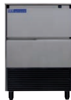
DELTA NG 150